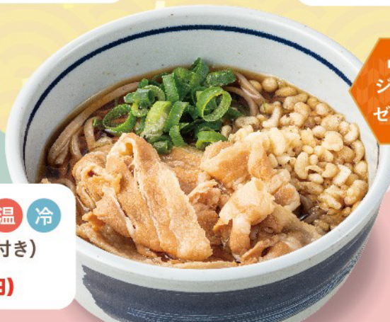
お子様とろろそば 温 冷 (リンゴジュース・ゼリー付き) 490円(税込539円)