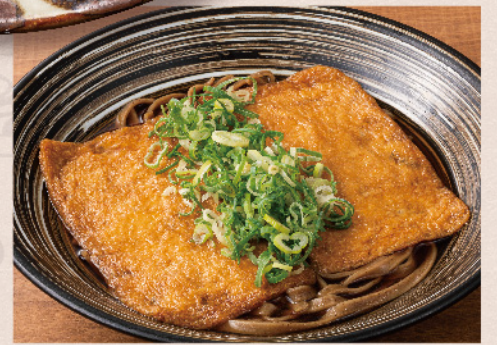
きつねそば 温 冷 630円(税込693円)