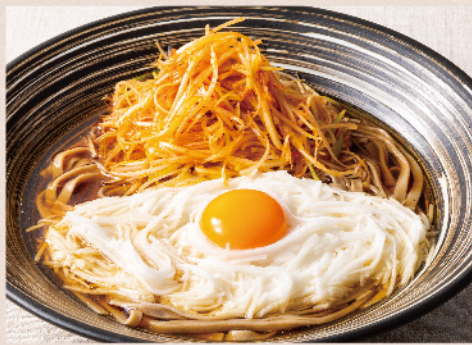
辛ネギとろろそば 温 冷 790円(税込869円)