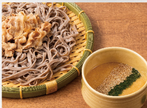
豚しゃぶとろろつけそば 冷 890円(税込979円)