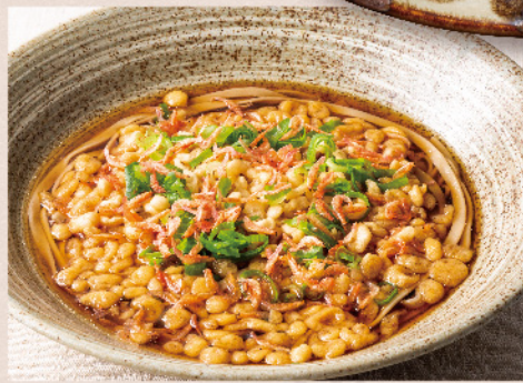
たぬきそば 温 冷 630円(税込693円)