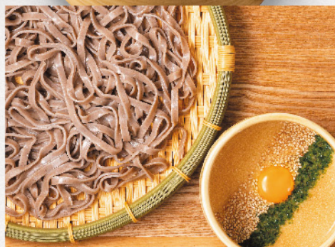
月見とろろつけそば 冷 790円(税込869円)