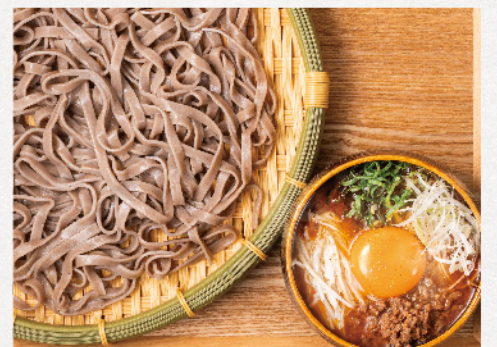
辛 担担とろろつけそば 温 850円(税込935円)